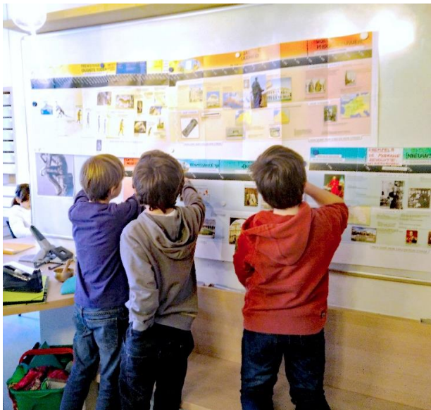
Werken met de tijdslijn 'van oerknal tot heden'