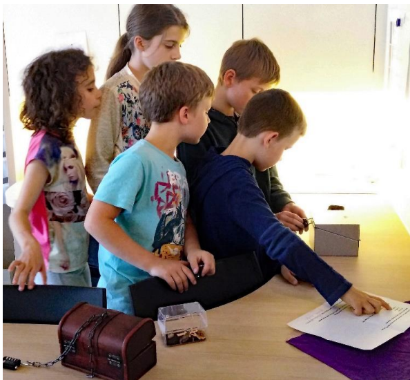
Escape room met eigen opdrachten