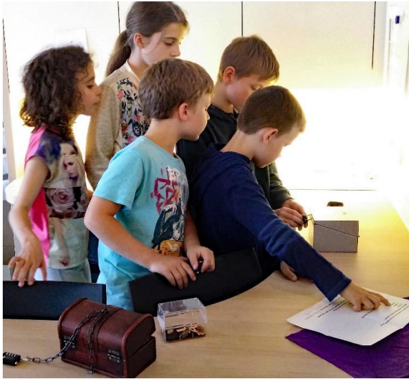
Escape room met eigen opdrachten