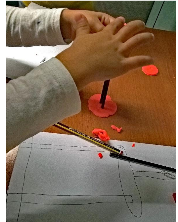
Proberen, mislukken en doorgaan!

Uw kind krijgt nooit twee keer hetzelfde te leren (zie onder 'Doelstellingen').