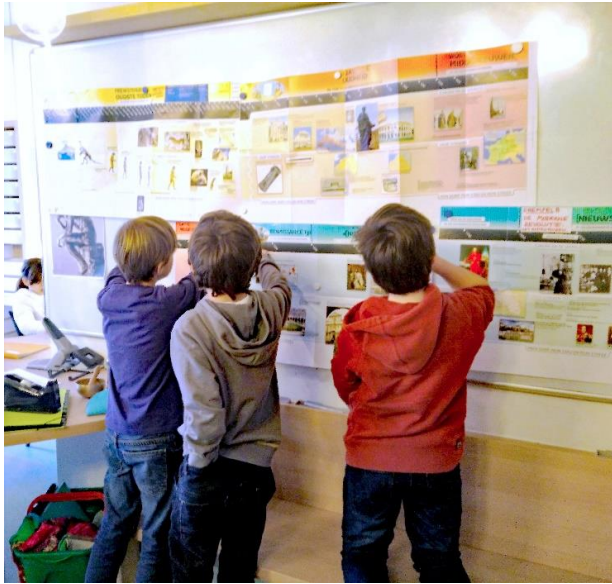
Werken met de tijdslijn 'van oerknal tot heden'